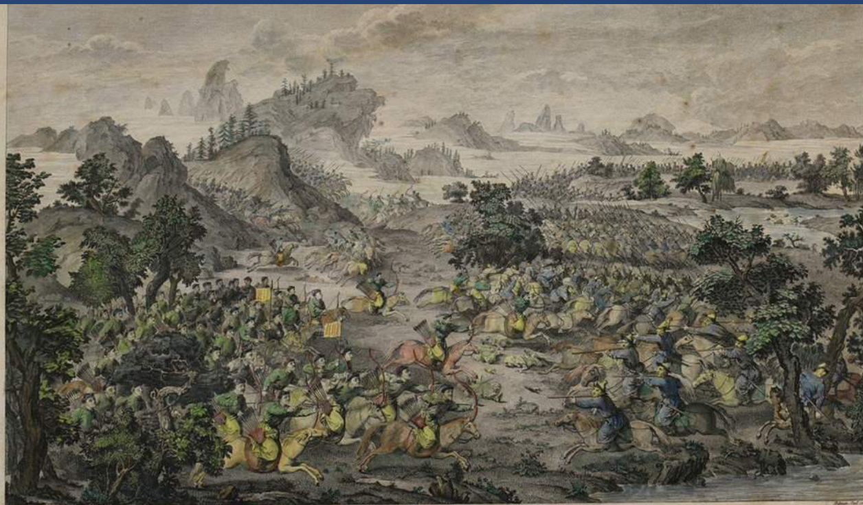
Bataille d'Albano gagnée par François le Grand le 21 Mars 1571. Peinture de Philippe de Champaigne. Musée de Versailles.