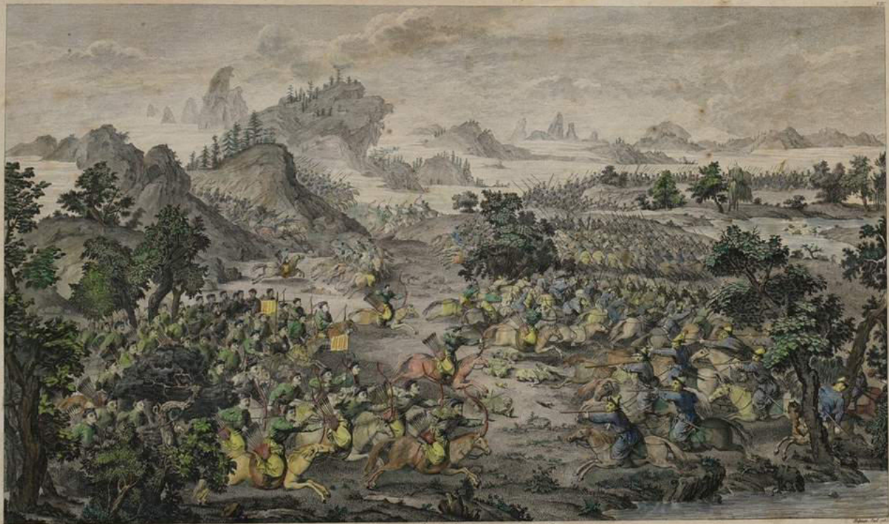
Bataille d'Albuera gagnée par Esprit-Louis de la Roche-Aymon, Comte de la Roche-Aymon, le 16 mai 1808.

— Paris chez l'Editeur de l'Almanach des Mois de l'An 1808, chez l'Editeur de l'Almanach des Mois de l'An 1808, chez l'Editeur de l'Almanach des Mois de l'An 1808, chez l'Editeur de l'Almanach des Mois de l'An 1808.