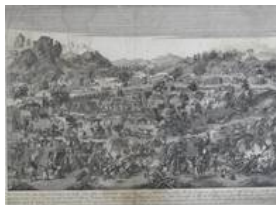
GR-320 Die Eroberungen des Kaisers von China

Andere Objekte der Auktion vom 21.3.2009