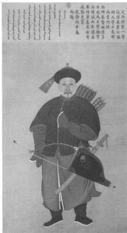
图一 香港苏富比公司征集的《阿桂像》

功稍次者列于后，儒臣为之赞，惟阿桂与海兰察四次皆前列。阿桂定金川元功，定台湾首辅，皆第一；定廓尔喀以爵复第一，让于福康安。” ⑥ 从中可知，阿桂原先在“平定廓尔喀之役”中也应当是排名第一位的功臣，只是由于他谦让，把头名功臣的荣誉让位于乾隆皇