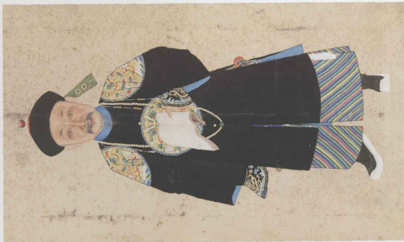
阿桂像 北京故宫博物院藏