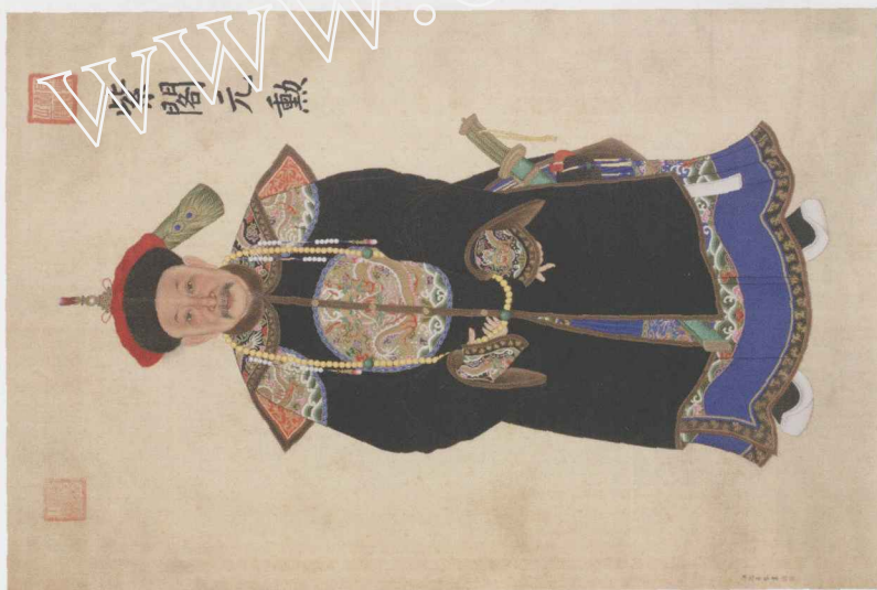
清人画阿桂像 北京故宫博物院藏