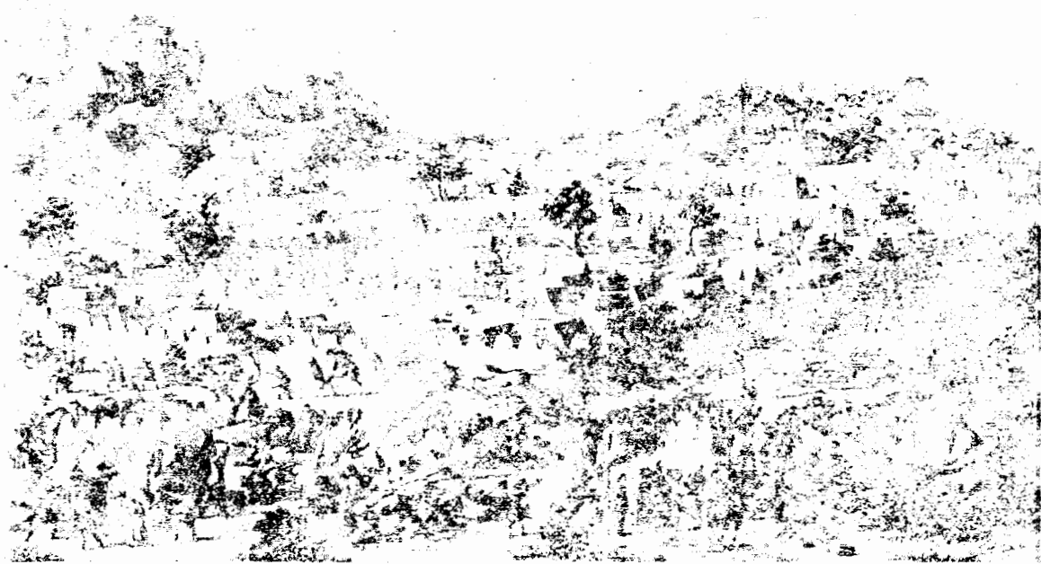
图一 《通古斯鲁克之战》图

这套组画在艺术上的第二个特色是采用全景式的构图。作者采用这样的构图形式是由于作品的内容所决定的。乾隆时平定准噶尔部、维吾尔部叛乱的战争，是在一个地域相当广阔的范围内进行的一场规模很大的战争，由于这样的特点，所以画家构思这套组画时就采用了全景式构图的方法，力求能够表现出这场战争的规模和全貌。如《库陇癸之战》一图（图版捌：2），画面分近、中、远三景，近景山坡树丛中，清军将领居高临下正在指挥作战；中景是清军的骑兵在冲击叛军营地，部分叛军在用火器射击，企图阻止渡河的清军，河对岸的叛军营地已经被清军占领；远景中，溃散的叛军退逃至山里，清军在背后乘胜追击。作者对这一战役作了十分出色的