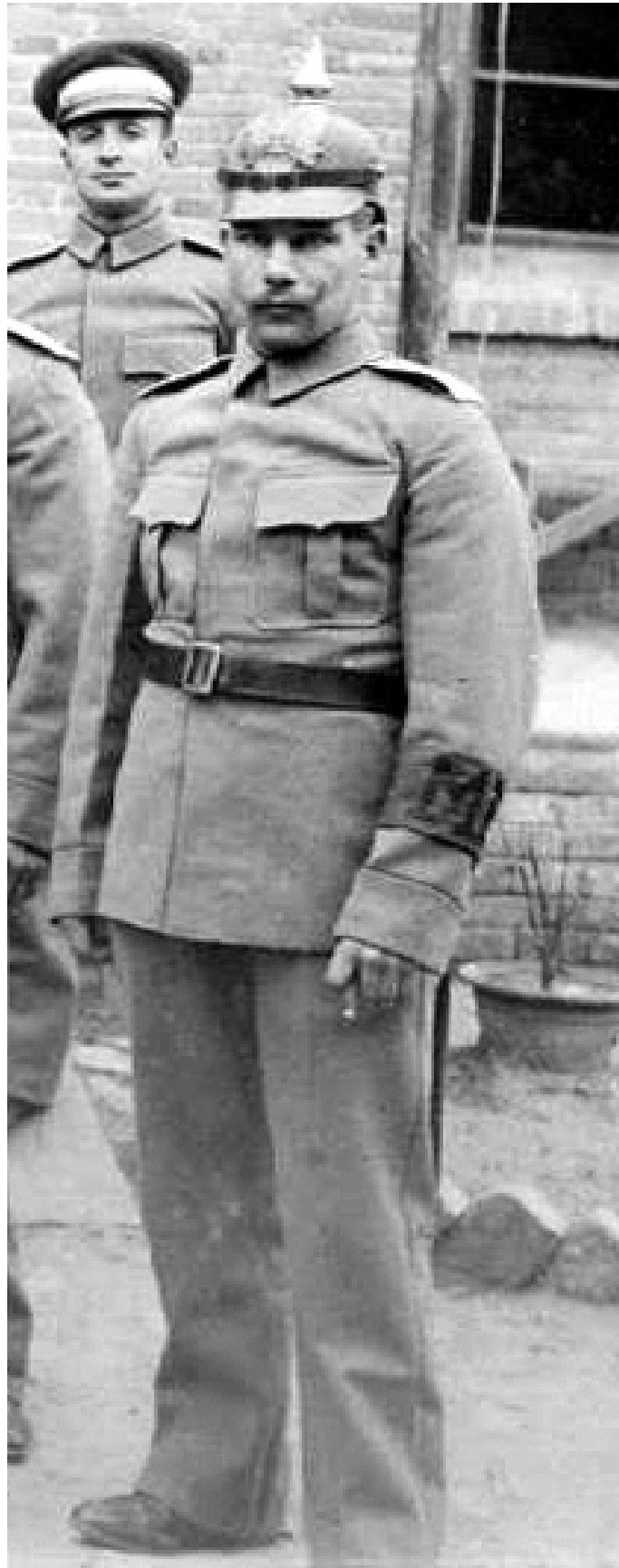
Militär-Polizei in Tientsin um 1907/09.