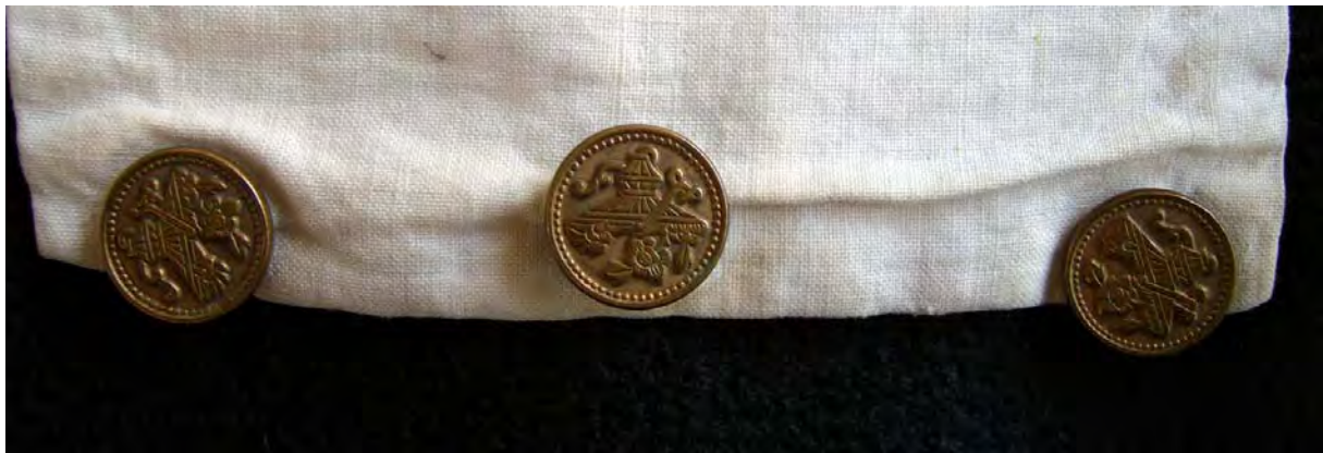
Die dazu verwendeten Knöpfe mit asiatischen Motiven.

Auch nach Rückführung der meisten Truppen des Ostasiatischen Expeditionskorps in die Heimat und dem Verbleib einer auf die Stärke einer gemischten Brigade reduzierten Ostasiatischen Besatzungsbrigade blieben bis zur Erfüllung der im Friedensvertrag festgelegten Bedingungen deutsche Truppen in China. Der Schwerpunkt lag in Tientsin, wobei auch deutsche Detachements in Peking, Yangtsun, Langsang, Schanhaikwan und Schanghai lagen und diese besetzt hielten.