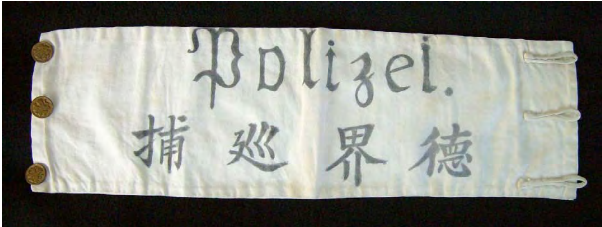
Behelfsmäßig in China hergestellte Armbinde mit deutscher und chinesischer Beschriftung.