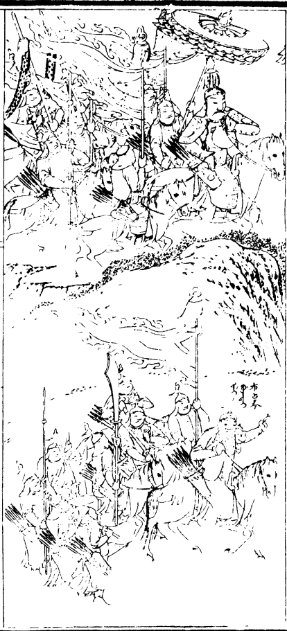
太祖率兵伐烏拉 蒙古 太祖 率 兵 伐 烏 拉