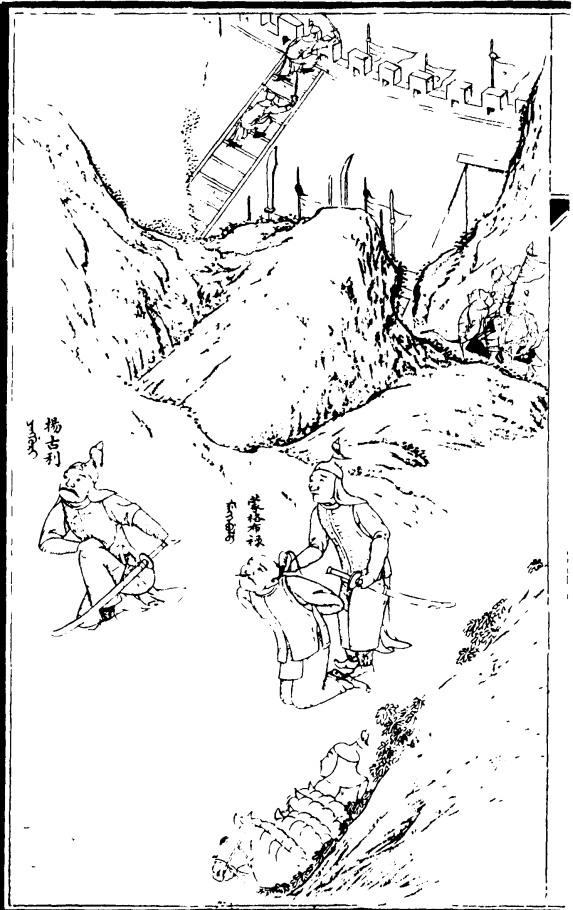
ᠶ᠋ᠠᠭᠤᠯᠢ ᠲᠠᠵᠤ ᠶ᠋ᠠᠮᠤ 楊吉利 太祖養蒙