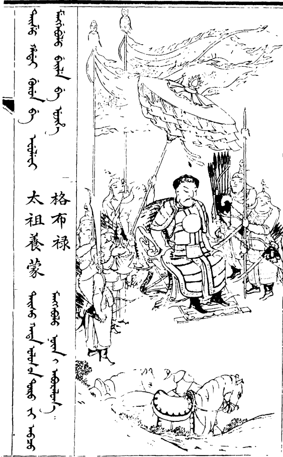
ᠭᠤᠪᠤᠬᠠ ᠲᠠᠵᠤ ᠶ᠋ᠠᠮᠤ 格布祿 太祖養蒙