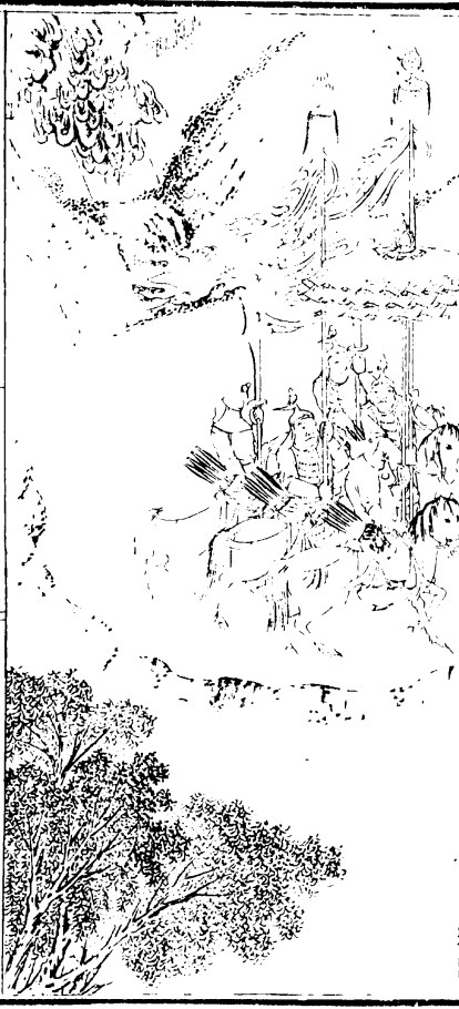
布占泰 太祖 義 責 蒙古 布 占 泰