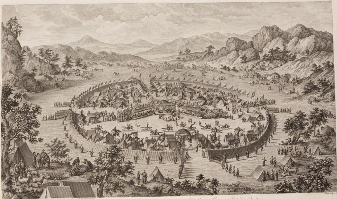
Tobago - Vue sur le Camp de la Cavalerie de S. M. le Roi Médecin, sous les ordres de l'Expédition de la grande Barbade, à la fin de la Campagne de 1762.

A Paris chez Bouché, M. de la Harpe, et chez les Citoyens de la République, sous le N. 1. de la Cour de la Ville de Paris, N. 62.