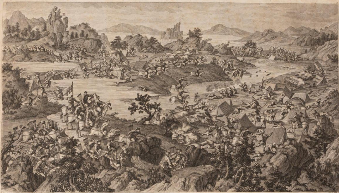
Le Lac - Le camp des Espagnols pour attendre le secours de S. M. le Roi de France, et le commandant de l'armée de l'Empire, le jour du combat de Ta-Ou-Ta, près de Amoy-Soua, à qui plusieurs mille familles ont perdu en un seul jour leur vie. A Paris chez la Citoyenne de la République, au Salon de la République, N. 274.