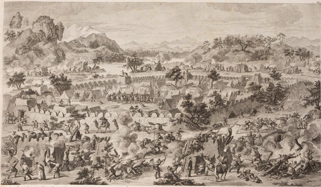
Année 1761. Le Roi de Sardaigne par le Colonel de l'Armée de France, le Comte de Saxe, se rendit à son camp avec ses troupes. Le 24 de Mars il se fit de bon matin à l'entrée de l'Armée commandée par Turrey et M. de Launay il fut chez les Turcs, et en fit.

à Paris chez M. de la Harpe, N° 1. et chez M. de la Harpe N° 2.