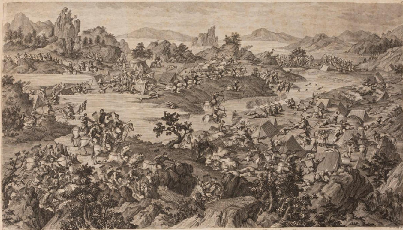
Le Camp de l'Empereur pour attendre Anwar-Sara, et commandé par mille hommes de l'Empire, opposé à la force des braves Turcs. Le camp de Anwar-Sara, et fut gouverné par son fils, au mois de Mars 1702. A Paris chez Basse, chez L'Empereur, rue d'Anvers N. 22.