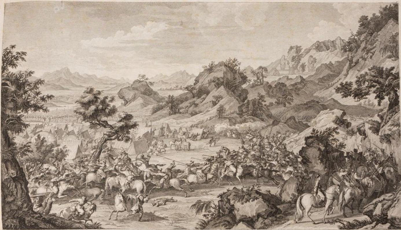
Tout est en vain. Les ennemis ont pris le fort de la ville, et les Français, qui étoient dans le fort, ont été obligés de se retirer dans le fort de la ville. Les ennemis ont pris le fort de la ville, et les Français, qui étoient dans le fort, ont été obligés de se retirer dans le fort de la ville.