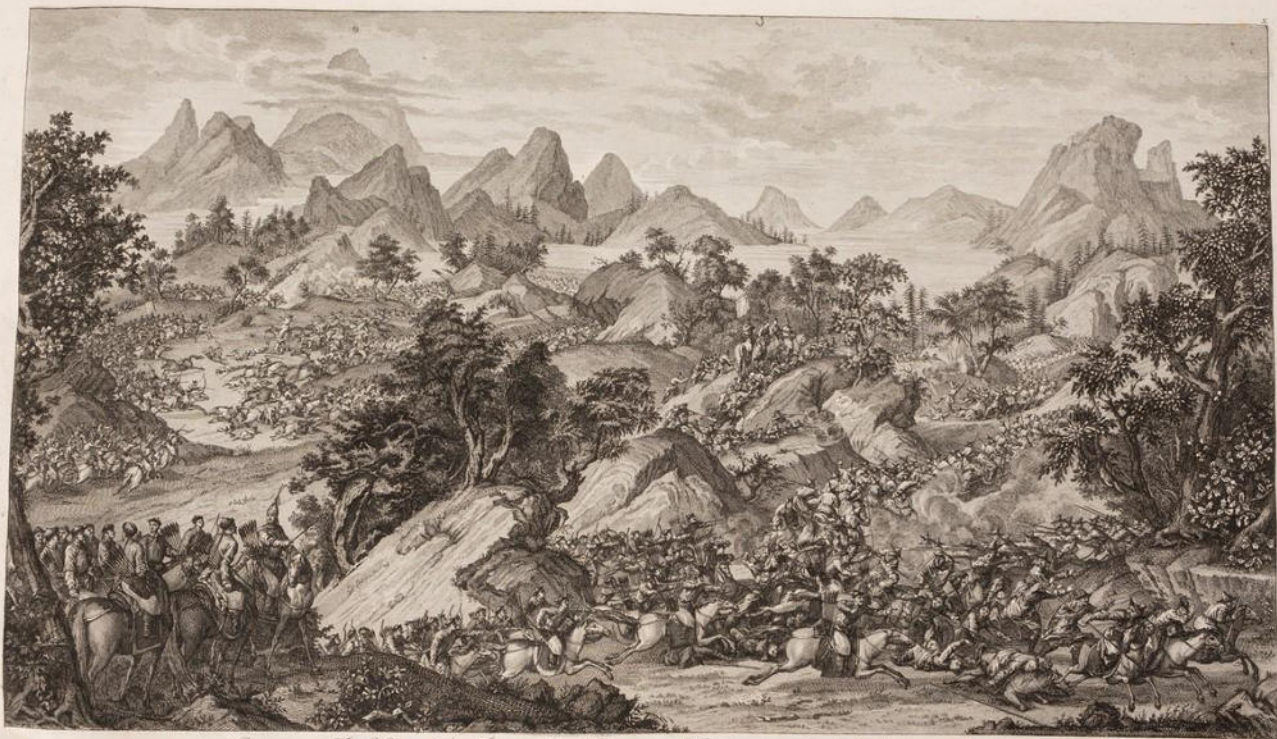
Bataille gagnée par Tchou-Kou, le 27. Juin. 1741. contre le Roi de Siam et celui de Mandchou et les rois de Siam-Ki. Des autres Etats. Année 1741. A Paris chez Barthelemy, Palais National, au Salon de Peinture, N. 62.