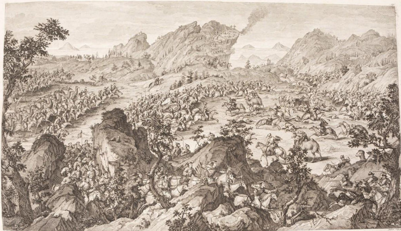
Combat de Amoy sur le Montagne de Pantah-Kel près de Loe de Poulung-Kel et Wah-Kel et de Wah de Badukhem Fou & Te commandé les Troupes Impériales contre les Jou Hoi-Chou . Le Combat se fait le jour le Grand Roi-Chou y prit l'Arme Chinoise et se battoit indivisible avec le général de la Cavalerie de la partie Sinoise . A Paris chez David l'Art de la Guerre en 1789. N. 12.