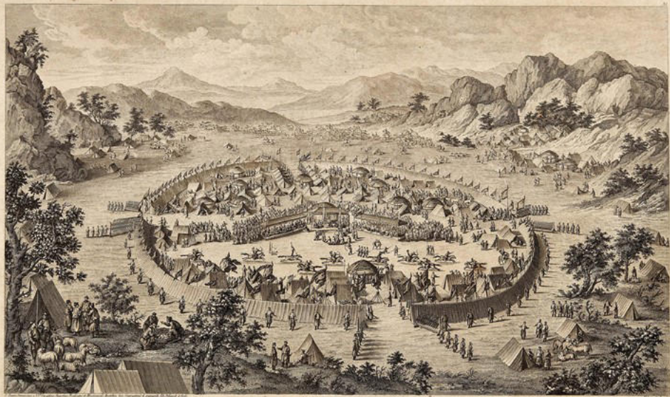
Tabac de Nain, camp de l'Armée de la Couronne à la fin de la Guerre d'Amérique, par le Capitaine de la garde (Schubert), à la fin de la Campagne de 1761.

Le Plan de l'Armée de la Couronne, de l'Armée de la République, et de l'Armée de la République, par le Capitaine de la garde (Schubert), 1761.