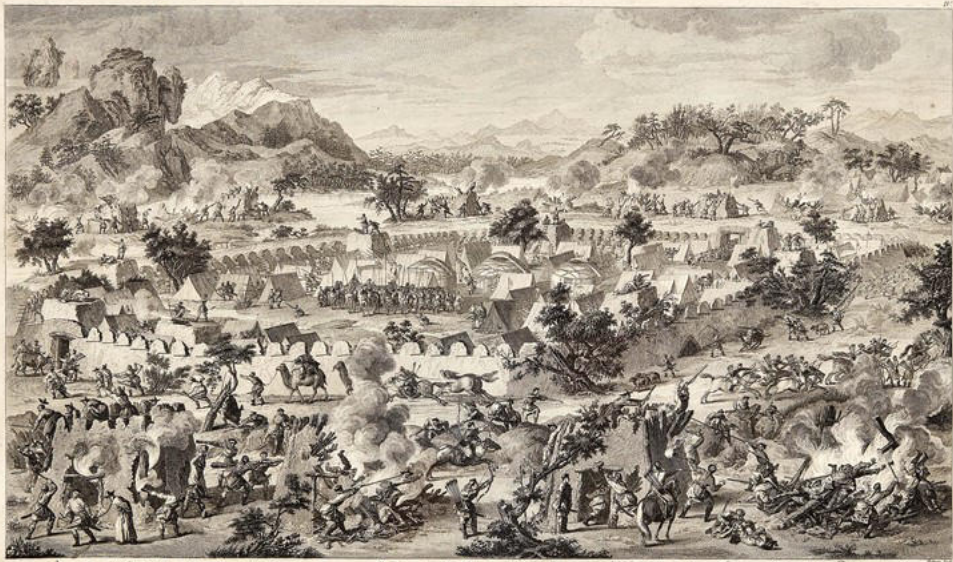
A l'attaque de la ville de Chelvi par l'Empereur le 10 Mars 1741. Le camp de l'Empereur est au bas de la colline de la droite & le camp de la ville est au bas de la colline de la gauche. Les figures sont de la même grandeur que les figures de la ville. On voit dans le bas à droite un soldat qui se bat avec un cheval.

Le dessin est de M. de la Chapelle, gravé par M. de la Chapelle.