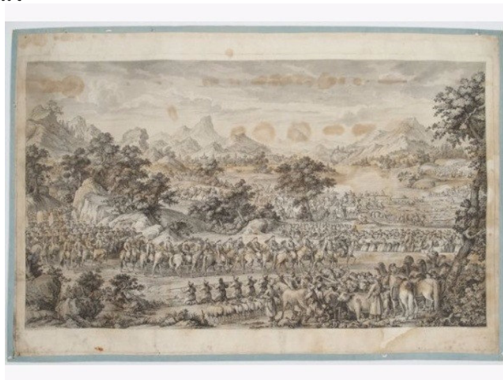
Art de la Chine et d'Ex.Orient ART D'EXTREME-ORIENT